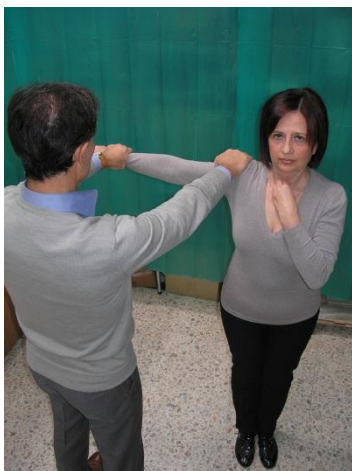
Test Chakra Gola