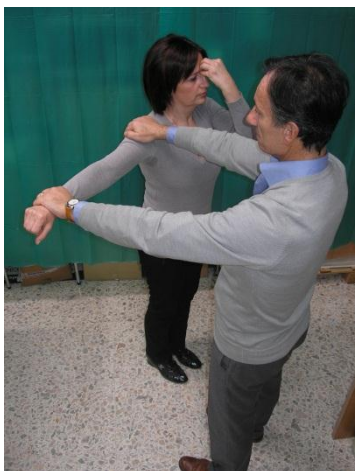
Test Chakra Terzo Occhio