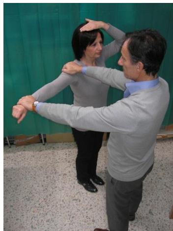
Test Chakra Corona